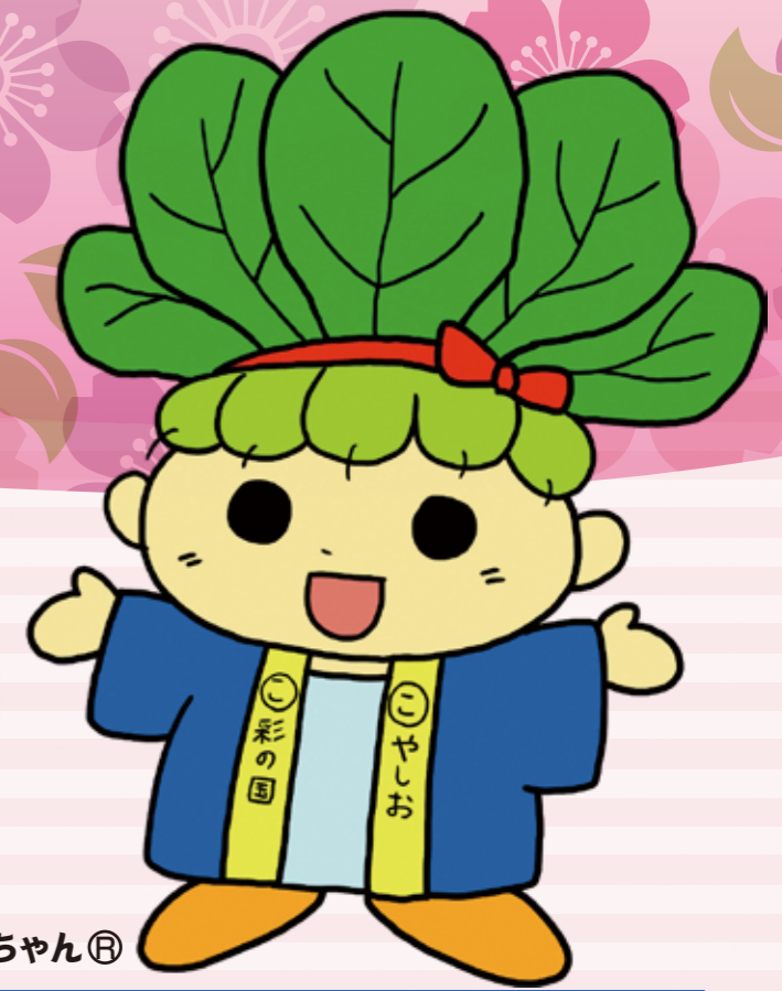
ハッピーこまちゃん®