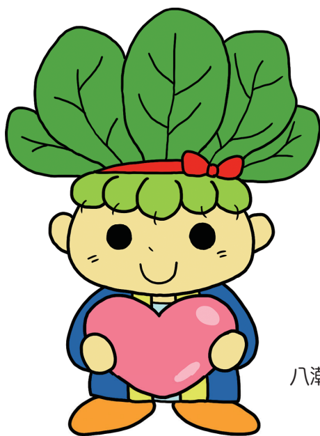
八潮市マスコットキャラクター 「ハッピーこまちゃん」