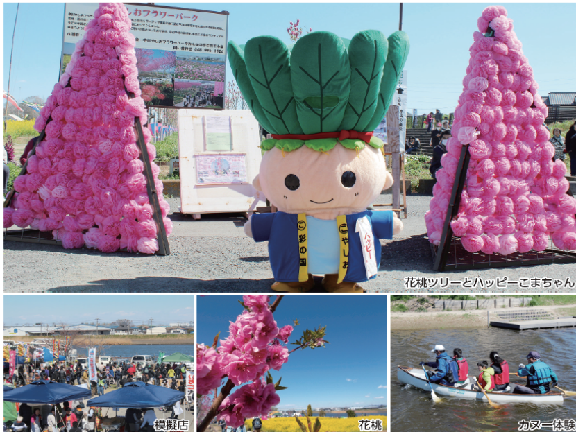
花桃ツリーとHappyこまちゃん