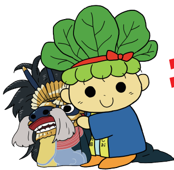
ハッピーこまちゃんと八潮の獅子舞