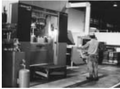
市内のプレス工場