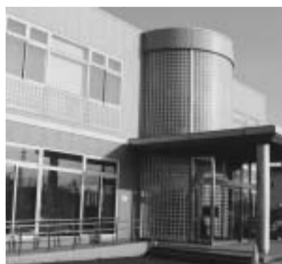
リサイクルプラザ

「幸之宮橋」を降りると右手にリサイクルプラザがあります。ここでは、ビンやアルミ缶などの資源ごみを再生させるため、主にゴミの分別作業を行っており、施設見学や体験講座(夏休みなど)も実施しています。また、年に数回販売するリサイクル家具や自転車は、大変に好評を得ています。ぜひ一度、私たちが毎日出しているゴミのゆくえを探ってみてはいかがでしょうか。 「幸之宮児童遊園」の次、「北交番」手前には、明治6年に創設された、歴史ある八條小学校があります。6月1日現在で児童数474人、「学習・人・心・命・物」五つの大切の実践を教育に取り入れ、賢く、明るく、思いやりの心をもった児童の育成をめざしています。