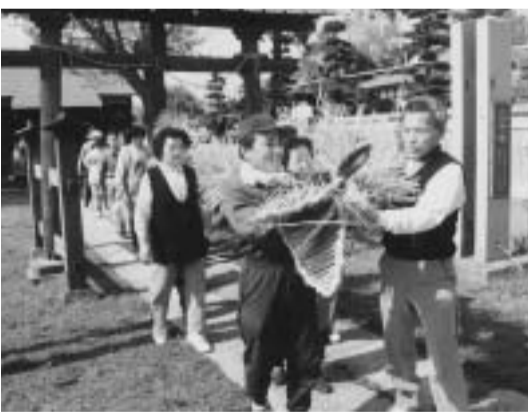
鶴ヶ曾根上久伊豆神社の「蛇ねじり」

35 八潮高校 県道平方東京線沿いに、停留所「八潮高校」があります。県立八潮高校は、文武両道、地域に密着した高校で、ソフトボール・ボート・陸上競技においては市の出前講座に登録し、スポーツの楽しさを地域の皆さんに紹介、指導しています。 また、停留所から北東方向に5分ほど歩くと、鶴ヶ曾根上久伊豆神社があります。毎年、4月20日には、「蛇ねじり」が行われます。これは、400年以上前から続く祭礼行事で、悪疫が村に入り込むを防ぐために薬蛇を祀る、辻ざり行事として伝わったものとして、市指定無形民俗文化財・県選無形民俗文化財となっています。