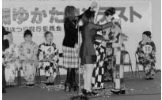
ゆかたコンテスト