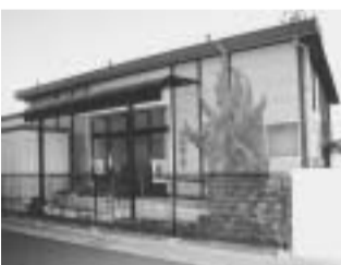
心身障害者地域デイケア施設「虹の家」

「虹の家」に滞在させるもので、障害のある方の、より一層の精神的自立を目指しています。