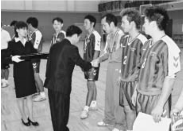
(左上)選手宣誓、(左下)観客席も興奮、(右上)開催地代表「埼玉フェニックス」健闘、(右下)優勝した香川県チームに市長からメダル授与