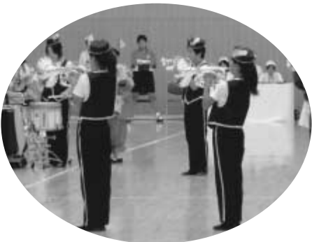
八條北小マーチングバンド