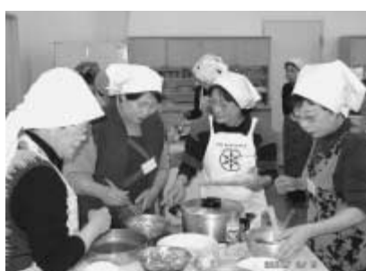
調理講習会で活躍する会員の皆さん

意欲が湧き、本番に向けて待つのみといった現在の心境です。まだ見ぬ選手団の皆さんとの出会いに、調理班は温かな気持ちをお料理に込め、歓迎の意を表したいと思っています。