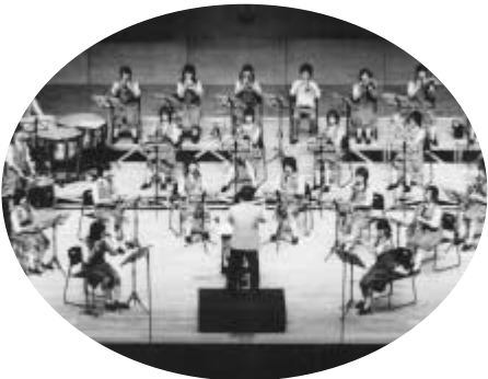
八潮中学校吹奏楽部