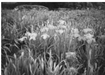
八潮南公園の菖蒲 不法係留を解消するため平成6年に設置され、現在では196艇を保管しており、中川や東京湾などへの水のレジャー拠点となっています。

停留所「中川小学校」の周辺は、区画整理事業が実施されており、新たな道路づくりなど市街地整備が計画的に進められています。 停留所の名称になっている中川小学校は、昭和47年4月に市内で6番目の小学校として開校し、現在、181人の児童が通学しています。学校教育目標には「がんばる子・考える子・心の美しい子」を掲げ、学校の近々を流れる水量の豊富な中川のように、「心豊かな中川っ子」の成長を願っています。 また、近くには市民の憩いの場所となっている「八潮南公園」があります。市内の公園の中では最も南に位置し、ソフトボール場や遊具のほか菖蒲田があります。この田では、毎年6月ごろに見事な菖蒲が咲誇り、一見の価値があります。 停留所から南に少し離れて、(財)埼玉県河川公社が設置した「大場川マリナー」があります。この施設は、プレジャーボートの中川の不法係留を解消するため平成6年に設置され、現在では196艇を保管しており、中川や東京湾などへの水のレジャー拠点となっています。