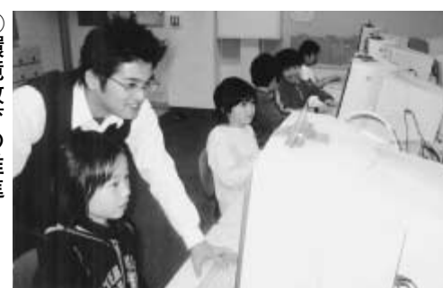
パソコンを使った授業

充実、視聴覚機器の活用と研修の充実、コンピュータ教育の推進、教育放送利用の充実、施設設備の充実を図ります。