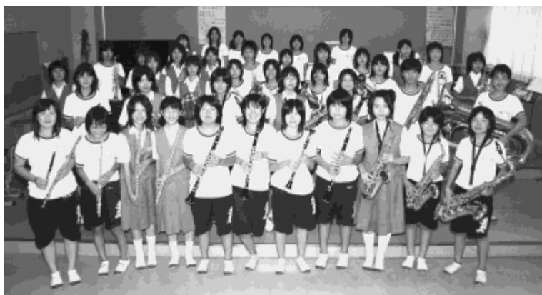
▲八潮中学校吹奏楽部 西関東吹奏楽コンクール出場(埼玉県吹奏楽コンクール県大会 金賞・埼玉県代表)