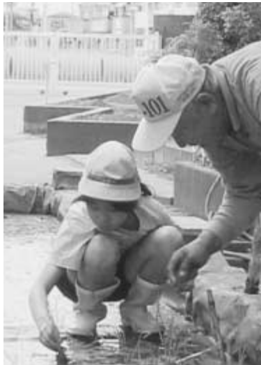
総合的な学習 田植え