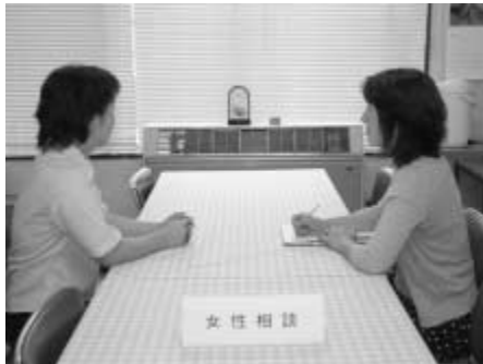
▲写真はイメージです

ひとりで途方にくれたり、悩んでいないで「女性相談」を訪ねてみましょう。きっと、気持ちが楽になり、力が湧いてきます。相談は無料で秘密は固く守ります。また、緊急の相談には、男女共同参画課窓口においても随時、情報提供等を行っています。