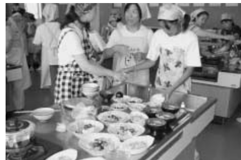
7月に行われた親子料理教室

実践校の八潮中学校では、地域の方や八潮市青幹会、食生活改善推進会を始めとする多くの方々のご支援・