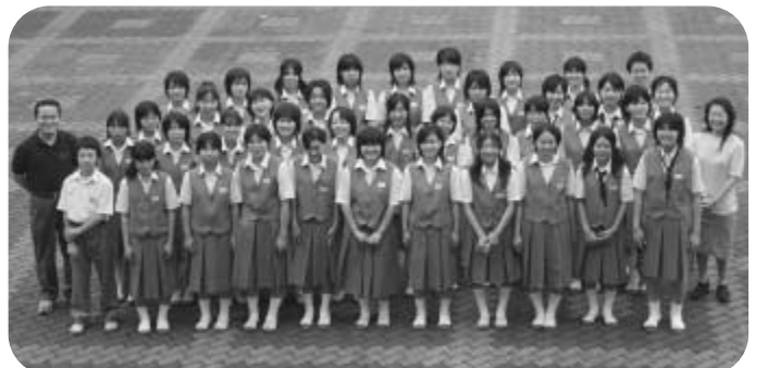
八潮中学校吹奏楽部 西関東吹奏楽コンクール出場