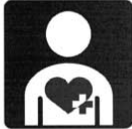
ハート・プラスマーク

市民の皆さん一人ひとりが、ノーマライゼーションの理念に基づき、内部障害のある方に対する理解を深めていただきたいと思います。