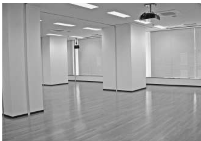
◀ホール（仕切りを外した場合）

3月31日までの問い合わせは、生涯学習まちづくり推進課 ☎④465、または八潮メセナ ☎998-2500へ