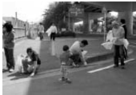
第18回ゴミゼロ運動