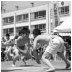
第16回わんぱく相撲八潮場所(12日)