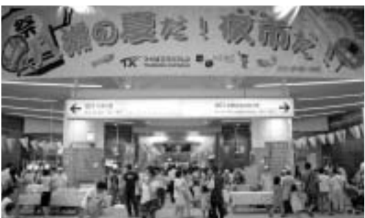
八潮の夏だ! 夜市だ! 2007

つくばエクスペレス八潮駅開業二周年フェスタ「八潮の夏だ! 夜市だ! 2007」(3、4日)