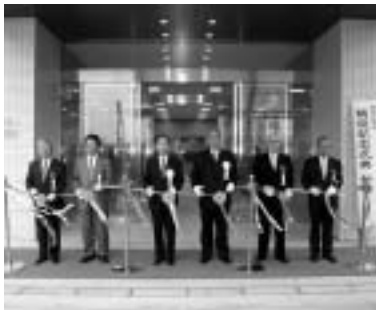
駅前行政施設オープン