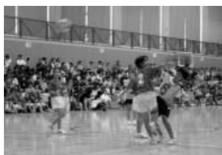
第3回八潮ハンドボールクラブ杯