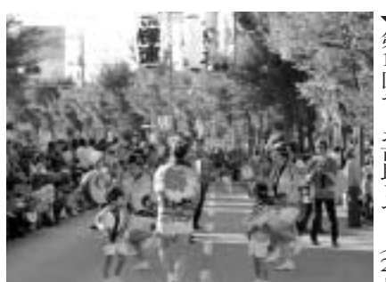
第16回やしお市民まつり