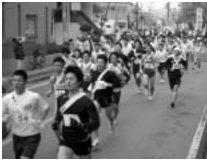
第42回市内一周駅伝大会