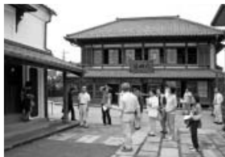
市指定文化財「太田屋住宅・蔵」一般公開