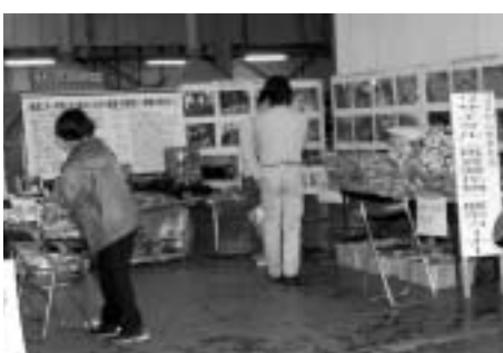
第18回リサイクルフェア