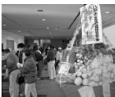
第33回八潮市農業祭