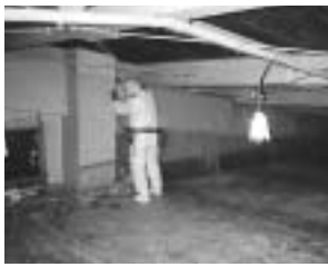
アスベストの除去作業

市では、子どもたちが充実した学校生活を送れるよう、快適で明るい学校施設を築くため、小、中学校の改修工事や、修繕工事を行っています。また、平成17年度(22,995千円)、18年度(15,750千円)において、子どもたちの安全を確保するため、吹き付けアスベスト(当時の規則では基準値以下の含有量)の除去等の工事を実施しました。