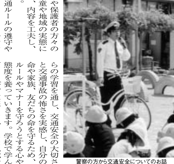
警察の方から交通安全についてのお話

小学校では、第1学期の間に、安全な歩行や正しい自転車乗りができるように、交通安全教室を実施しています。交通指導員さんを始め、交通安全協会や保護者の方々の協力により、児童や地域の実態に応じ、体験活動等、内容を工夫し、進められています。