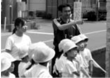
校外学習「まち探検」の様子

「学生ボランティア補助教員事業」は、市が文教大学等の協力を得て、教員を目指す学生を市内の小・中学校に補助教員として配置し、よりきめ細やかな教育を実現するために実施しているものです。