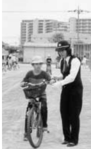
交通指導員による自転車の乗り方指導

小学校では、第1学期の間に、安全な歩行や正しい自転車乗りができるように、交通安全教室を実施しています。交通指導員さんを始め、交通安全協会や保護者の方々の協力により、児童や地域の実態に応じ、体験活動等、内容を工夫し、進められています。