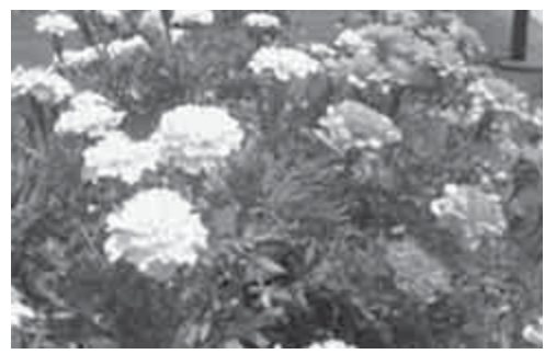
マリーゴールド (花期6~10月)