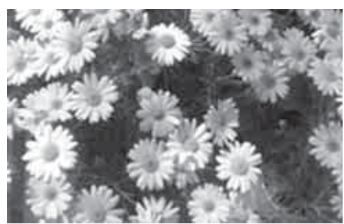
マーガレット (花期3~6月)