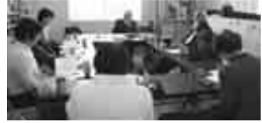
和やかな例会の様子