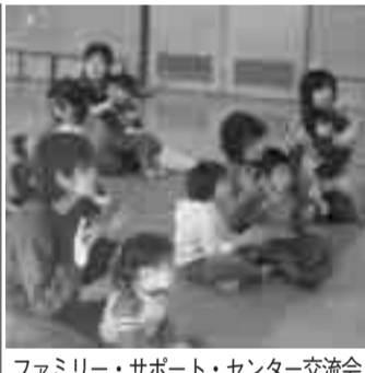
ファミリー・サポート・センター交流会

ファミリー・サポート・センターは、地域において育児の援助を受けたい方と、援助を行いたい方が会員になり