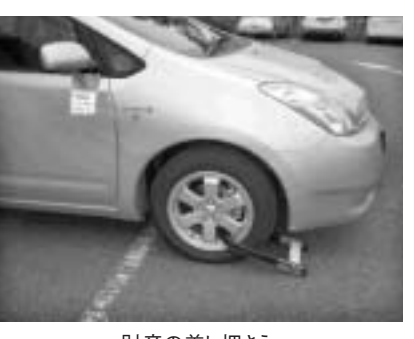
財産の差し押さえ

●STOP滞納!5市1町市税徴収強化月間(11月～平成22年1月) 越谷県税事務所と5市1町(八潮市、草加市、越谷市、三郷市、吉川市、松伏町)では、市税等の滞納整理をこれまで以上に強化します。 未納の方には、督促状や催告書をすでに送付していますが、このまま連絡もなく納付されない場合、自主財源確保の重要性および納付期限内に納付されている多くの方との公平性を確保することから、法律の規定により財産(不動産、預貯金、給与、生命保険、自動車等)差し押さえなどの処分を受けることがあります。 未納の場合は速やかに納付してください。なお、特別な事情等により納付が困難な場合は、必ず納税相談を受けてください。