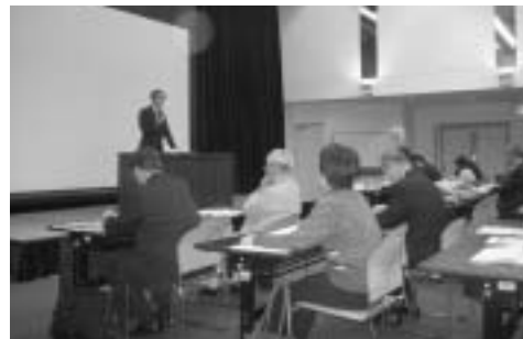
学力向上連携部会からの研究報告の様子