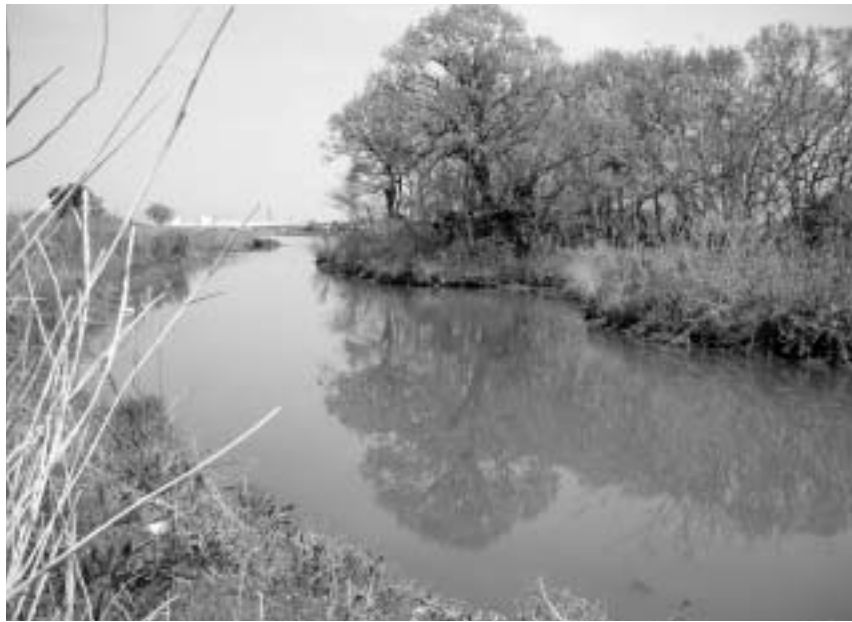
八潮に残る貴重な自然、中川のワンド

※ワンドとは、流れのゆるやかな入り江のこと。生き物がすみやすいので、水を浄化する力や、川が再生する力が強くなります。