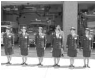
回6月10日までに、消防本部総務課 (☎996・0119)へ

回一般の部 市内在住・在勤・在学 (市内サークル所属を含む)の高校 生以上の方、参考の部 他展覧会 で受賞した作品を出品する方 回洋画(油絵・水彩画・アクリル画・ 版画)、日本画(日本画・水墨画)、 彫刻、工芸、陶芸 ※作品の規格が例年とは変更になり ました。詳細はお問い合わせくださ い。また、展覧会は実行委員会によ る運営です。出品者(団体の場合は 代表者)は、実行委員会に出席して ください。 回9月6日、搬出 9月13日 ※搬入時間(午前9時30分～正午) に注意ください。 回1人2点以内、未発表のものに限 る。(参考作品を除く)