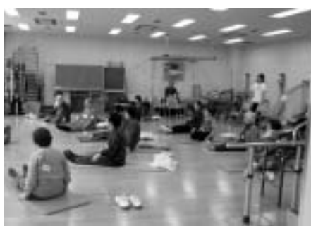
運動器の機能向上教室の様子