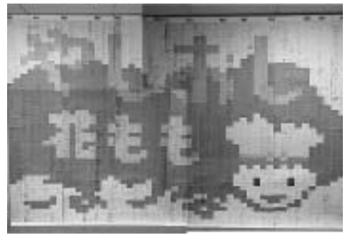
問人権・男女共同参画課 ☎811、社会教育課 ☎357

10月は埼玉県12市町の「人権を考える月間」です。今年は、市内全小中学生が書いた人権についてのメッセージをつなぎ合わせたモザイク画を作りました。