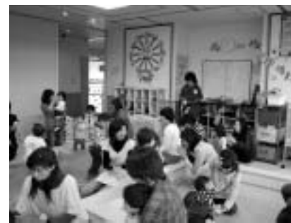
はちじょう子育て支援ひろば

めています。 ●歳出：児童、高齢者や障がいのある方などへの支援にかかる民生費、道路や排水路などの整備にかかる土木費などが大きな割合を占めています。 また、特別会計および企業会計の予算執行状況は、表2のとおりです。