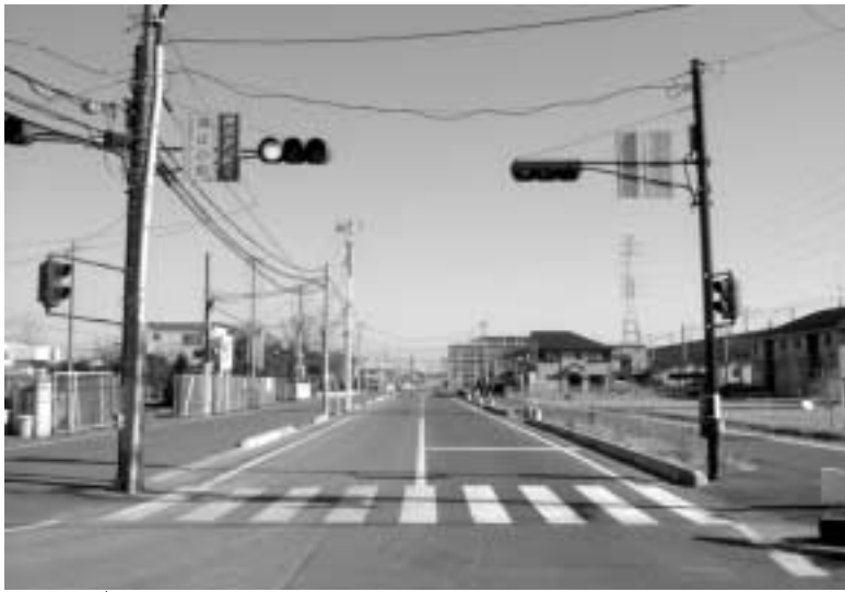
区画整理事業で整備された坊三郷線（潮止小学校前）

皆様にはご負担をお願いすることになりますが、ご理解とご協力をお願いします。今後とも市では、限られた財源を最大限有効に活用し、更なる行財政改革を行い、行政内部の経費の削減を徹底して行うとともに、都市基盤整備を着実に実施し、市民の皆様が安心して暮らせるまちづくりを進めていきます。