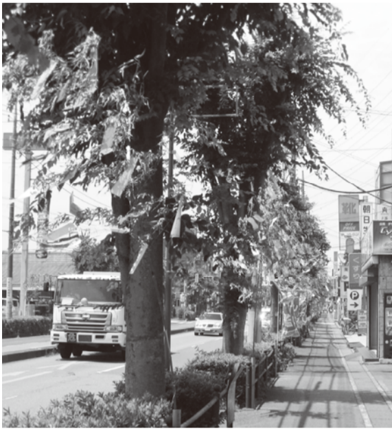
けやき通り商店会七夕まつり