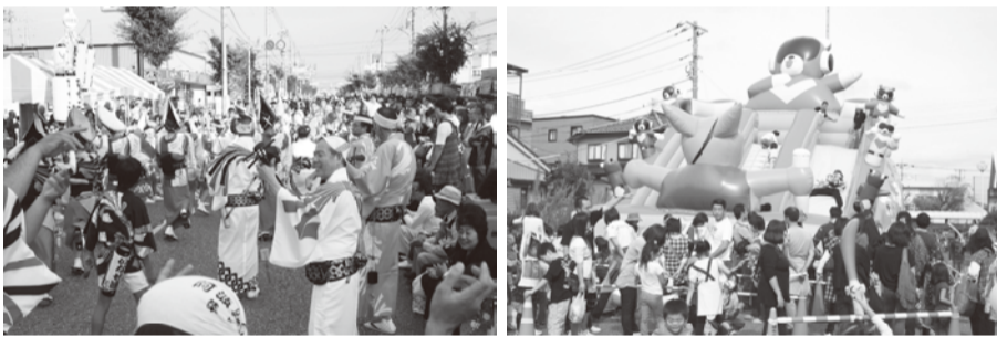
☎ やしお市民まつり実行委員会事務局(市民協働推進課内) ☎ 465

※会議の回数は各部会によって異なりますが、全体を通して4月からまつり終了まで月1~2回程度(予定)です。なお、パレード部会、子どもまつり部会は、当該部会の他に実施組織4部会(総務部会、安全対策部会、美化推進部会、広報記録部会)のいずれかへ加入をお願いします。