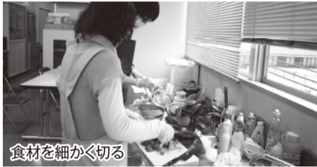
食材を細かく切る

●発行／八潮市 ●編集／広聴広報課 〒340-8588八潮市中央1-2-1 TEL 048(996)2111(代表) ホームページ http://www.city.yashio.lg.jp/ FAX 048(995)7367 Eメール kochokoho@city.yashio.lg.jp