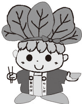
ハッピーこまちゃん®