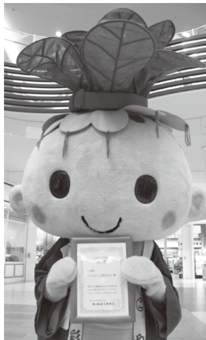
けんこう大使任命書をもつハッピーこまちゃん