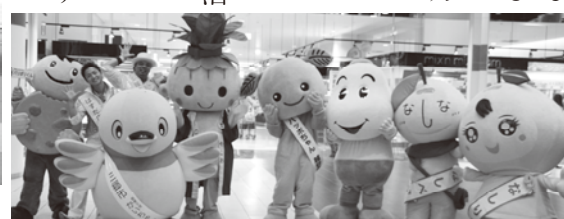
越谷レイクタウンでPR活動を実施

特定健診・特定保健指導やがん検診などのPR活動を行うため、ハッピーこまちゃんが県内のマスコットキャラクターとともに、「けんこう大使」として5月21日に埼玉県知事から任命されました。今後、特定健診などのPR活動を行います。