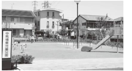
中馬場東児童公園の整備