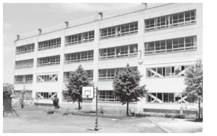
八條北小耐震工事