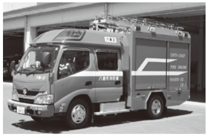
消防ポンプ車の購入