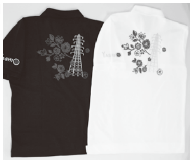
花桃と鉄塔をモチーフにしたデザインです

今年地域「絆・つながり」をテーマに盆踊りを中心に開催します。市特産品・推奨品や地元新鮮野菜の販売、つくばエクスプレス沿線の有名店の出店など盛り沢山。なお、「枝豆感謝祭」も同時開催します。 7月27日(金) 午後5時～8時30分、28日(土) 午後4時～8時30分(雨天決行) 場つくばエクスプレス八潮駅構内および駅南口公園予定地(駐車場はありませんので、公共交通機関をご利用ください) 内容盆踊り大会、模擬店、わくわく緑日コーナー、八潮市特産品・推奨品の販売、地元新鮮野菜の販売など 問合せ八潮市観光協会☎996・1926 ☆八潮オリジナルポロシャツを販売 7月27日(金)のみ、数量限定で販売します。 内容黒の2種類(各サイズあり) 費2000円