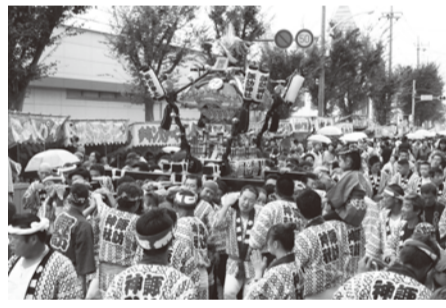
第21回やしお市民まつりの様子