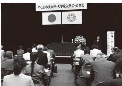
やしお市民大学・大学院の入学式