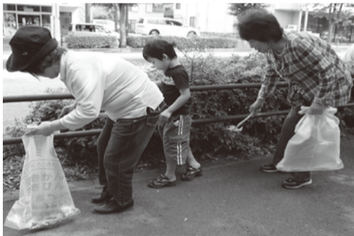
第24回ゴミゼロ運動