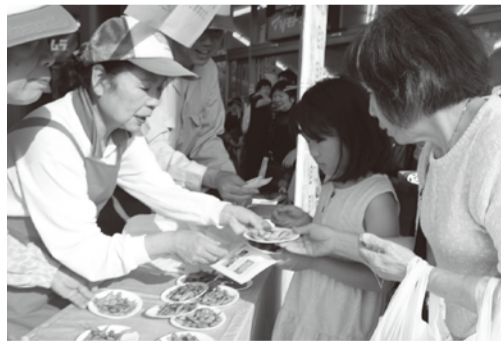
やしお枝豆ヌーヴォー祭