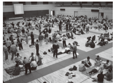
救急フェスタの様子

※AEDは、自動で心臓の状態を確認し、電気ショックが必要かどうかを音声メッセージで指示しますので、簡単に使用できます。