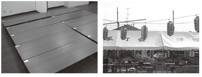
問市民協働推進課☎465

浮塚町会では、財団法人自治総合センターが実施している平成25年度宝くじ助成を受けて、テントやテーブル、町会名入りのちょうちんなどを購入しました。購入した物品などは、町会のコミュニティ活動で活用します。