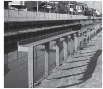
※水辺カウンターの利用開始は、3月を予定しています。