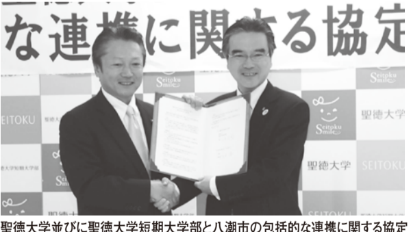
聖徳大学並びに聖徳大学短期大学部と八潮市の包括的な連携に関する協定

▼7月25日および26日、八潮駅構内や八潮駅南口駅前公園予定地などで、「八潮の夏だ！夜市だ！盆踊り大会だ！2014」と枝豆感謝祭を同時に開催。 ▼8月29日現在、八潮市被災農業者向け経営体育成支援事業により、2月14日の大雪で倒壊した5棟の農業用ハウスのうち4棟を修復。