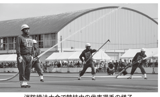
消防操法大会で競技中の代表選手の様子

▼6月22日、フレスポ八潮で、特定健診およびがん検診の受診率の向上などを図るため、PR活動を実施。 ▼6月23日、臨時福祉給付金・子育て世帯臨時特例給付金に係る申請関係書類を送付し、7月1日から、申請受付を開始。