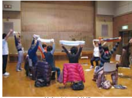
健康ストレッチ体操