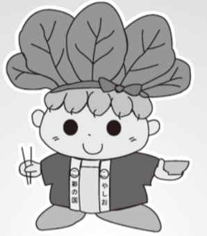
ハッピーごまちゃん®