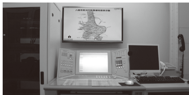
更新された固定系防災行政無線の操作卓

市債は、長い年月利用する公共施設などを整備するため、一時的に多額の費用がかかるときに金融機関などから借り入れる資金です。整備したときの市民がすべて負担するのではなく、長期間にわたって分割して負担する