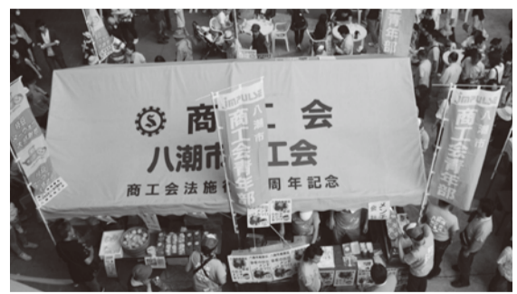
やしお枝豆ヌーヴォー祭

▼4月15日、大曾根小学校、柳之宮小学校および潮止中学校のプールろ過装置改修工事を発注し、4月16日には、大瀬小学校のプール塗装工事を発注。 ▼4月16日、歴史講座「八潮の観音信仰」と題し、県指定文化財大経寺千手観音菩薩立像などの見学会を、4月19日には、和井田家住宅修理現地説明会を開催。 ▼4月16日から5月11日までの間、古民家で、「端午の節句」の人形展示を、5月31日には、体験講座として「布ぞうりづくり」を開催。 ▼4月26日、市内小中学生が一斉に、携帯電話・テレビ・ゲーム機を使用しない日とする「第1回八潮市ノーデイ」を実施。 ▼4月30日、八潮メセナ雨漏り緊急修繕について専決処分し、5月12日から6月10日まで、八潮メセナ屋上の雨漏り緊急修繕工事を実施。 ▼5月1日現在の児童・生徒数は、6706人、学級数は231学級。 ▼5月9日から「春のスポーツ教室」として「基礎からはじめる小学生水泳教室」を開催。 ▼5月17日、八潮メセナで、平成26年度やしお市民大学・大学院の入学式を実施。