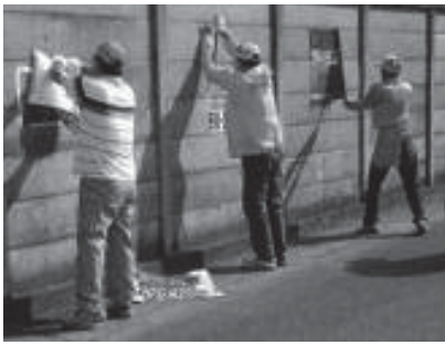
八潮おやじ倶楽部

会員は5人で、毎月1回、大原・八潮・中央を中心に活動しています。活動を始めて今年で7年目を迎えて、これまで除却した違反屋外広告物