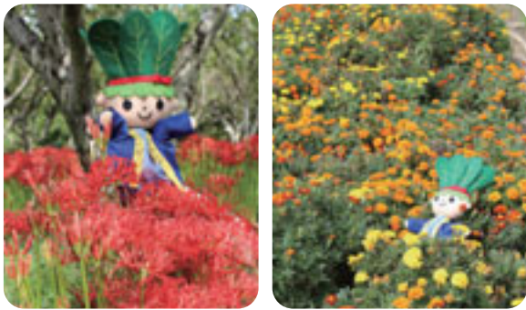
彼岸花など季節の花を紹介