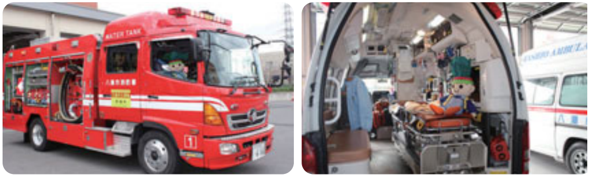
消防車や救急車を見学