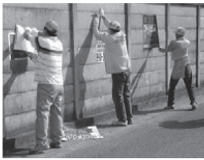
八潮おやじ倶楽部

会員は5人で、毎月1回、大原・八潮・中央を中心に活動しています。活動を始めて今年で7年目を迎えて、これまで除却した違反屋外広告物