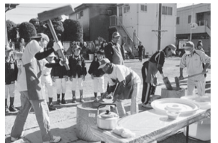
子どももちつき大会の様子

町会に加入することは任意ではありますが、高齢世帯や子育て世代の孤立防止や自然災害時の助け合い、地域の防犯などに役立ち、町会に加入している意義は大きいと考えています。「無関心」という「心」が独り歩きしない町会を目指しています。